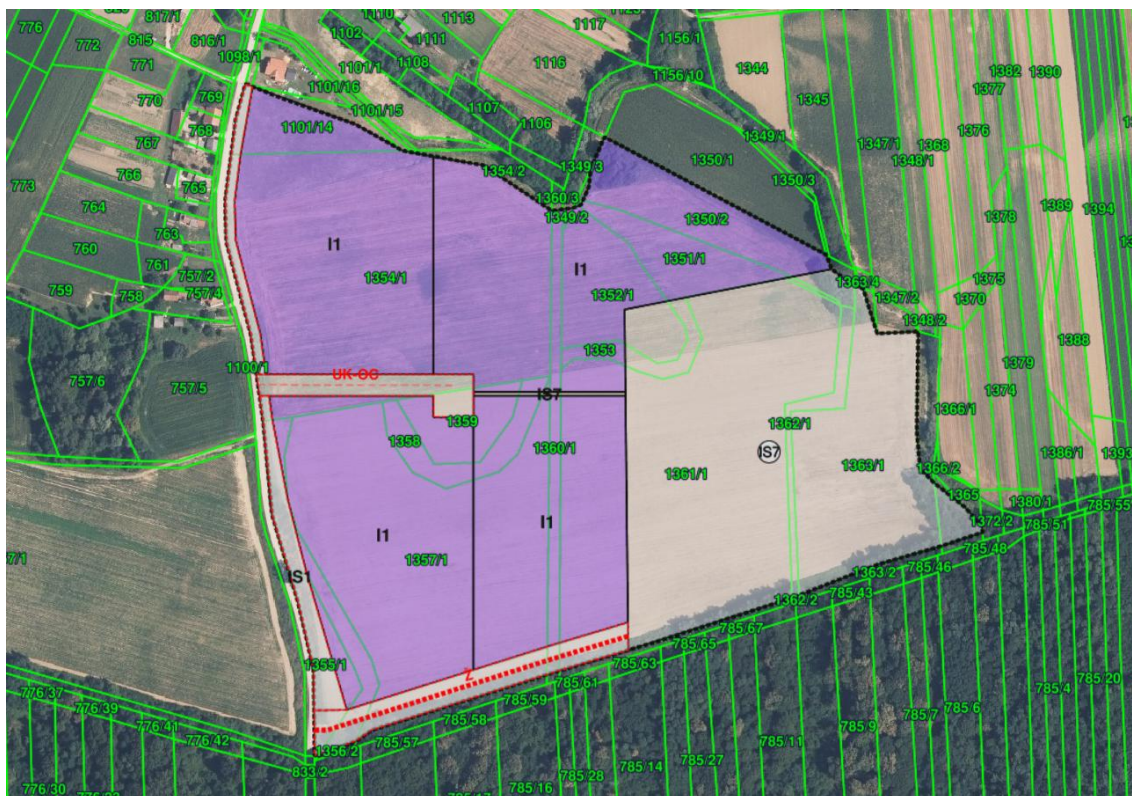
Prikaz 4 Plansko rješenje namjene prostora i pravila provedbe s prijedlogom parcelacije

Namjene površina su predefiniране Pravilnikom, a odabrane su one koje odgovaraju namjenama utvrđenim ciljevima prostornog planiranja.