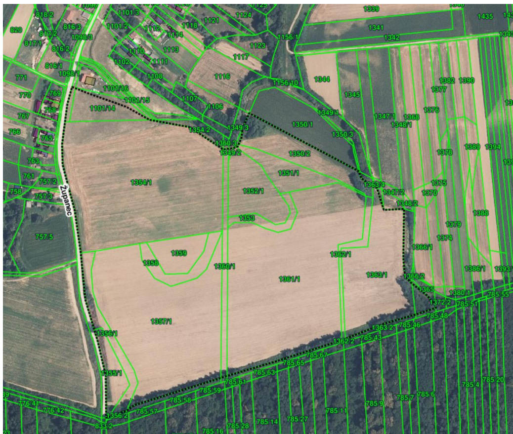
Prikaz 3 Detaljniji pregled obuhvata UPU – DOF 2021/22 s preklopljenim katastarskim česticama

Programska polazišta za izradu urbanističkog plana uređenja čine obaveze, smjernice i preporuke iz prostornih planova više razine i širih područja.